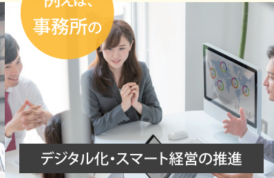
デジタル化・スマート経営の推進