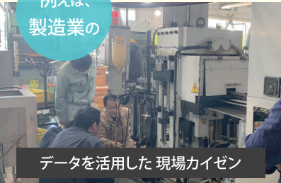
データを活用した現場カイゼン