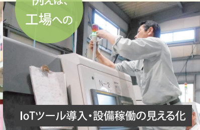
IoTツール導入・設備稼働の見える化