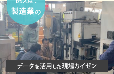
データを活用した現場カイゼン