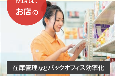
在庫管理などバックオフィス効率化