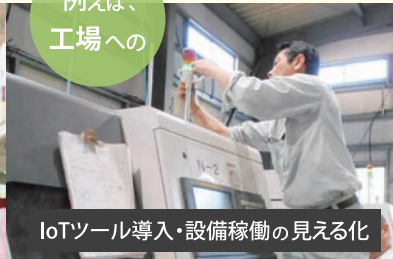
IoTツール導入・設備稼働の見える化