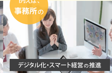
デジタル化・スマート経営の推進