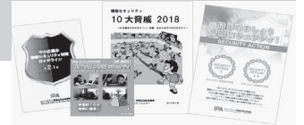
セミナー補助教材の一例▶