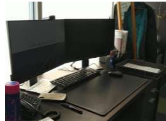
(デュアルディスプレイ マイク内蔵カメラ付き)