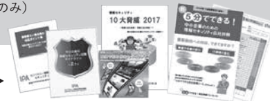
セミナー補助教材の一例 ▶